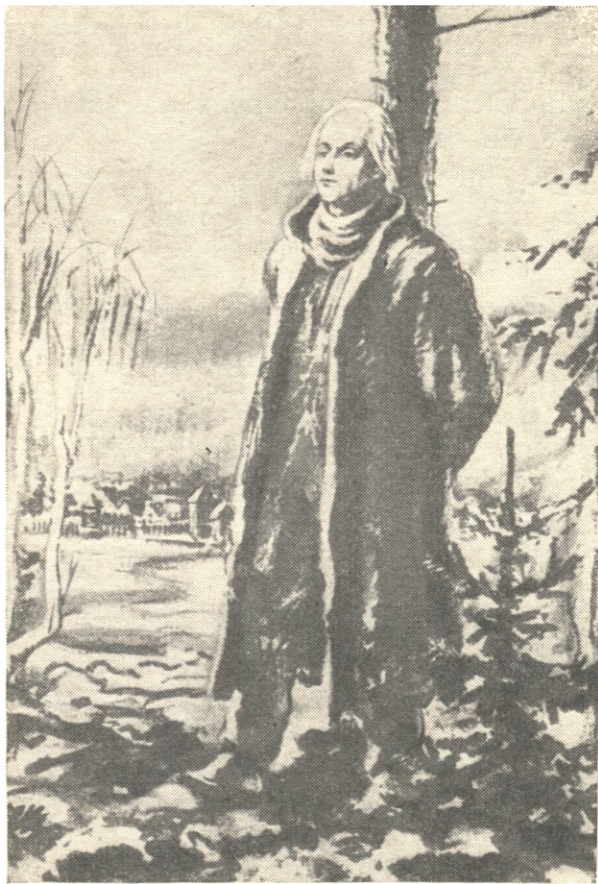
Радищев в Илимске. С акварели худ. В. И. Кайдалова. 1949 г.