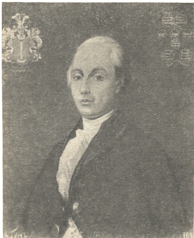
А. Н. Радищев. С портрета худ. К. Гуна.