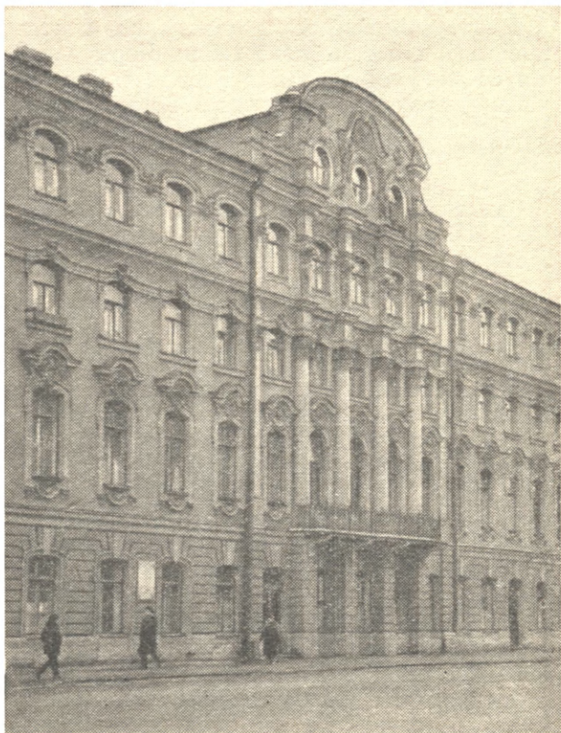
Дом на улице Марата, 14, в котором жил А. Н. Радищев.